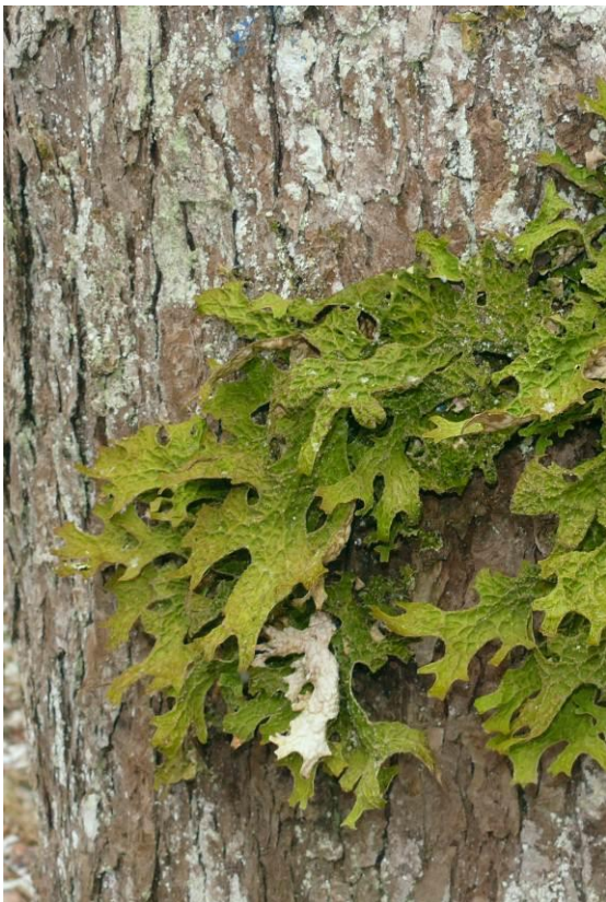
1. Надбородник безлистный