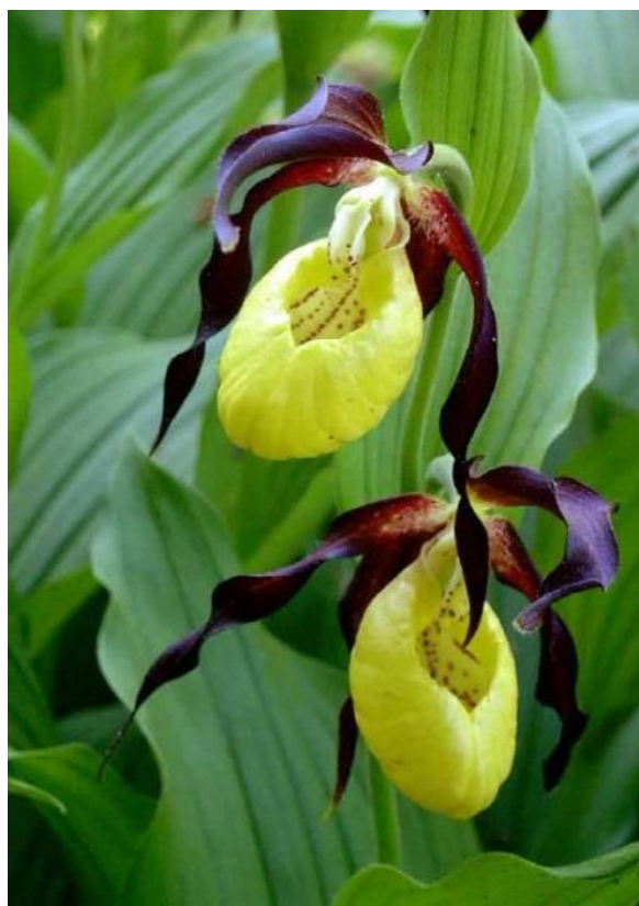
2. Ятрышник мужской