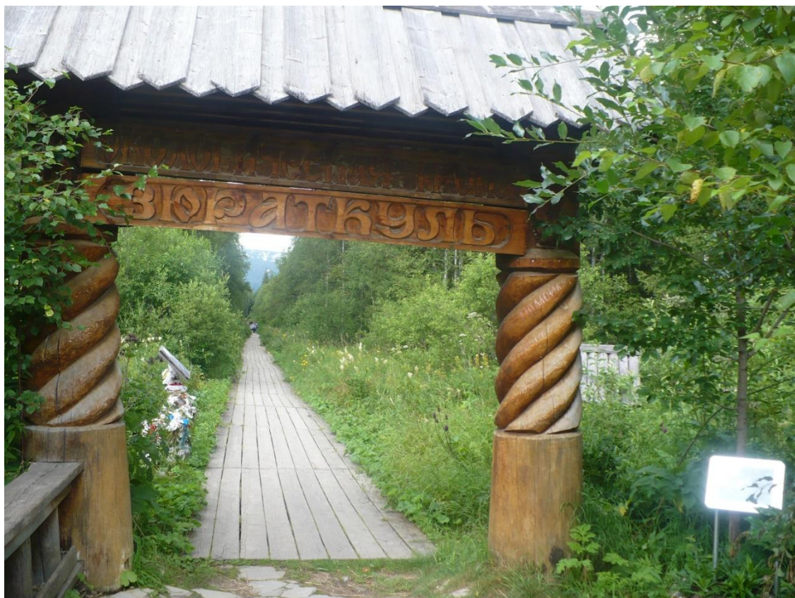
Тропа на хребет Зюраткуль