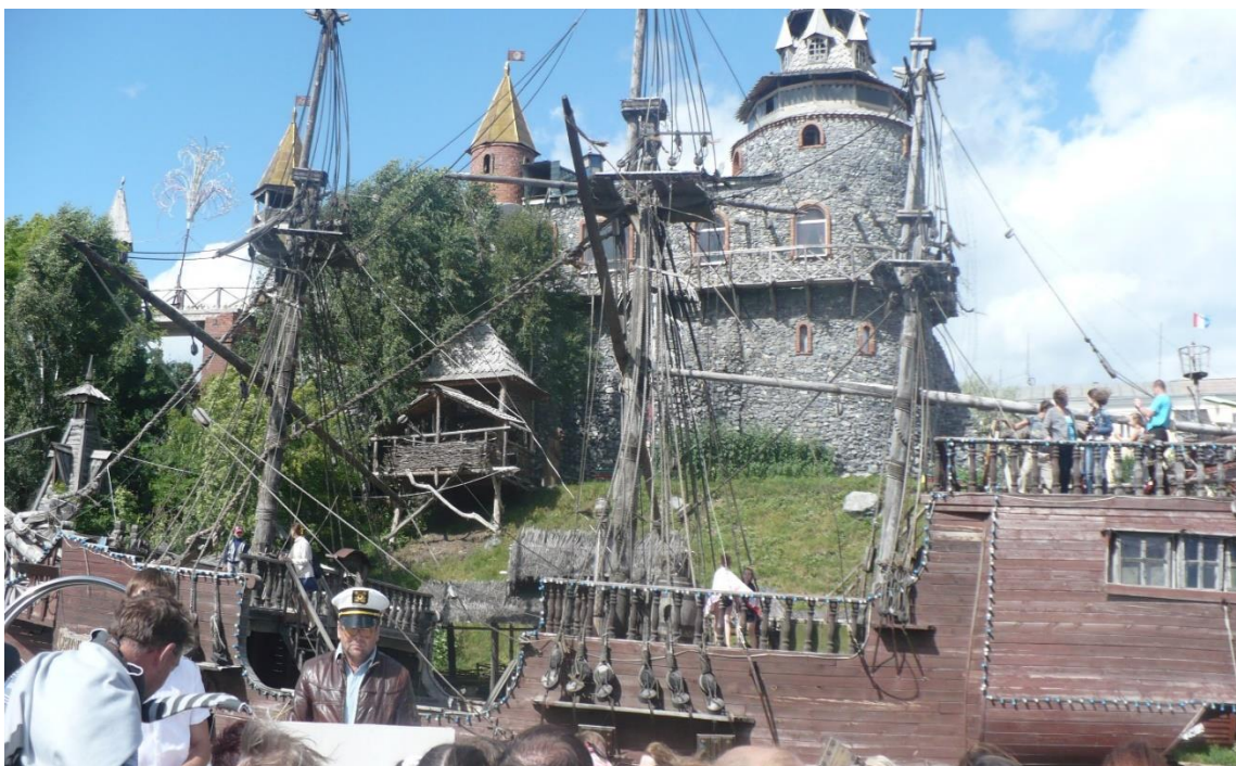
Аквапарк «Сонькина лагуна»