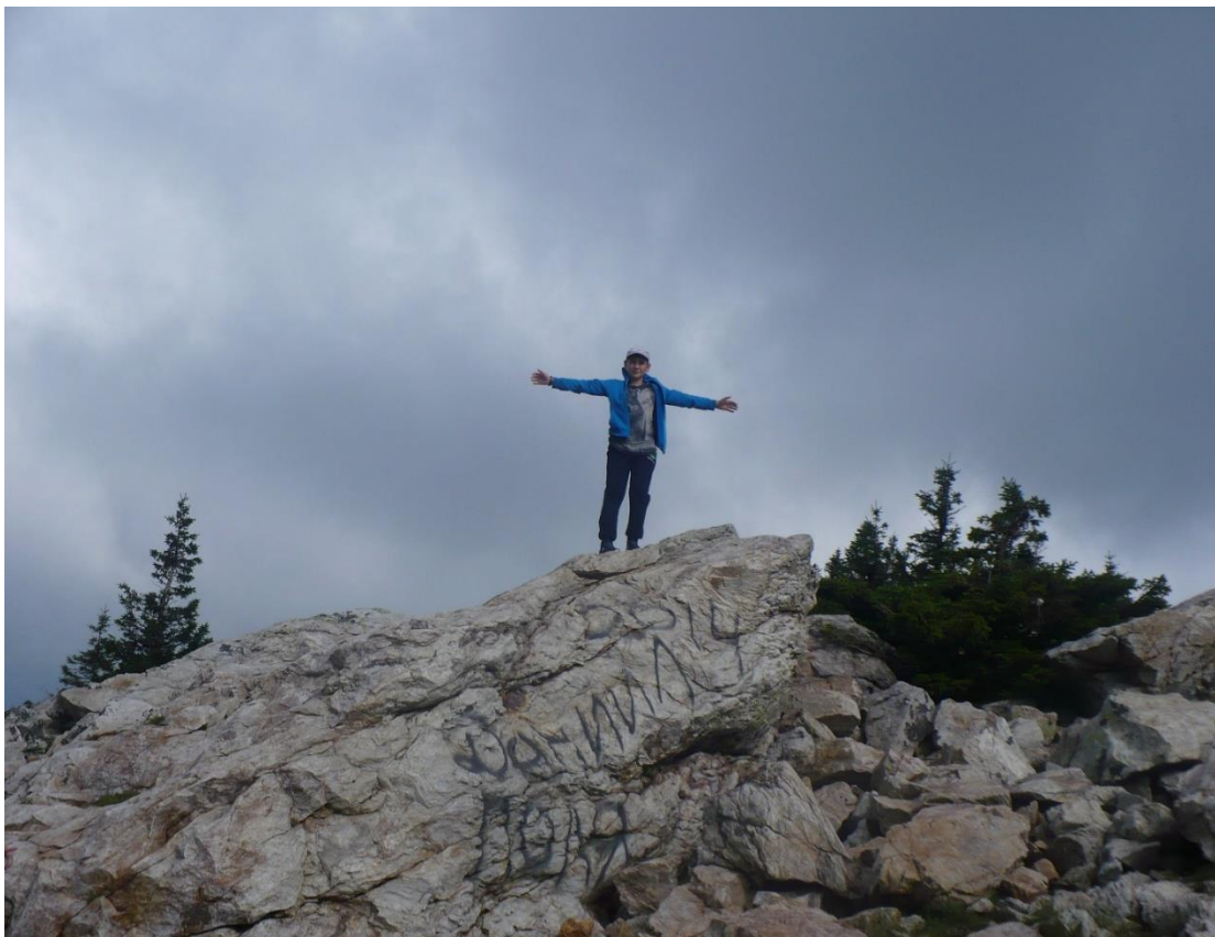
На вершине хребта Зюраткуль