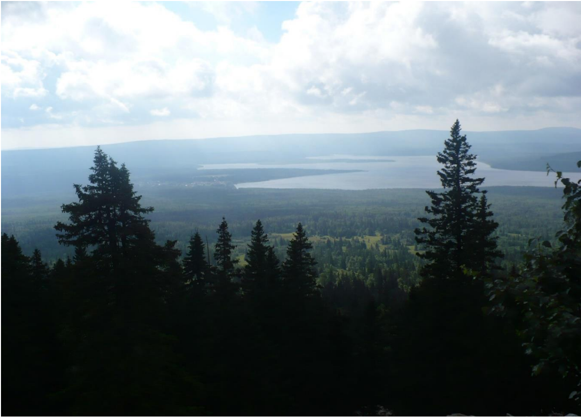
Национальный парк «Зюраткуль»